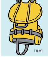
上記2点イラスト／上大岡トメ、タラジロウ