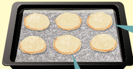
フチがきつね色に変わるまで焼く